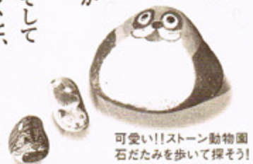
可愛い!! ストーン動物園 石だたみを歩いて探そう!

相田みつをに逢える 石だたみの道です。 JR足利駅・東武足利市駅から徒歩 8分、最も古都足利を楽しめる所が 石だたみの道です。 大日様の正面の「大日大門通り」、そして 足利学校前の「孔子様通り」を歩くと、 織物で染えた街らしく、 着物や布などの店を始め、 美・味・知を刺激する店が 軒を連ねています。 史跡の見学と共に石だた みのお店、相田みつをゆか りのお店などに立ち寄って みませんか。