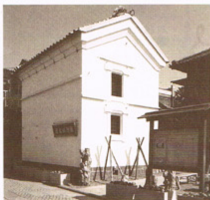
茂右衛門蔵 江戸期の機業家、小佐野茂右衛門ゆかりの蔵。 現在街おこし市民ギャラリーとして使用されている